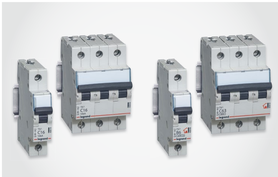
▶▶▶ Автоматические выключатели TX 3 6000 - 6 кА и автоматические выключатели TX 3 6000 - 10 кА, стр. 160