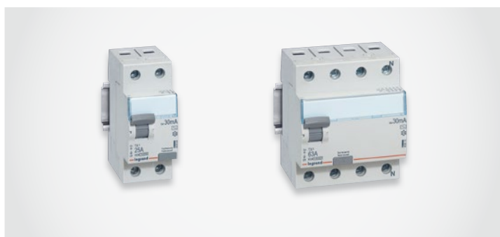
▶▶▶ Выключатели дифференциального тока TX 3 , стр. 162

Осуществляют защиту человека от поражения электрическим током при прямом прикосновении к токоведущим частям, а также защиту от возгораний и пожаров вследствие повреждения изоляции, неисправности электропроводки и электрооборудования.