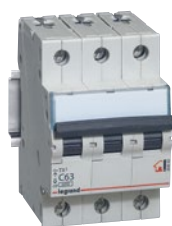
4 040 62