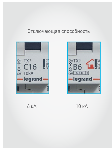
▶▶▶ Индивидуальная маркировка автоматических выключателей TX 3 на 6 кА и 10 кА