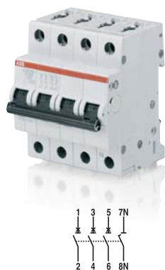
SK 029 B 02