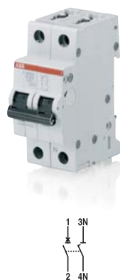
SK 033 B 02