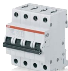
SK 029 B 02