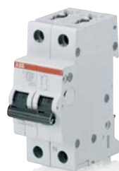
SK 033 B 02