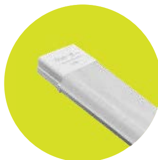
FL-LED LPO-L OPAL