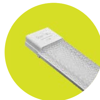
FL-LED LPO-L PRISMA