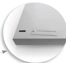
выдвижные пазики на корпусе