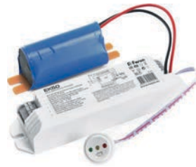
7W в аварийном режиме