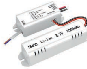
3-50W в аварийном режиме