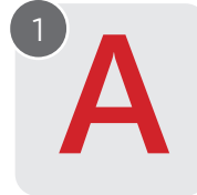
Наклейка-стикер «А» в комплекте