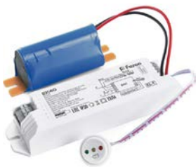
10-40W в аварийном режиме