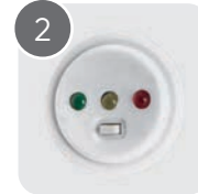
Кнопка TEST и индикаторы питания