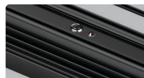
Тест аварийного режима

*60 месяцев гарантии для светильника и 12 месяцев гарантии для блока аварийного питания