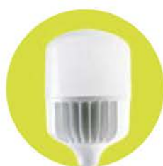
T140 / T150