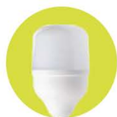
FL-LED T100 / T120