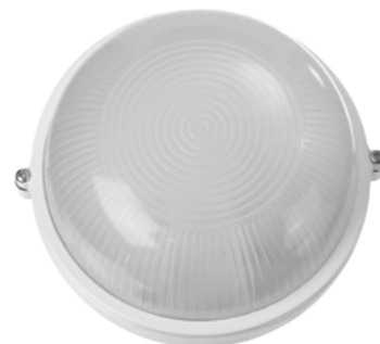
НБП 03-60-001 60W LxWxH,mm (176x82x190) арт.53169