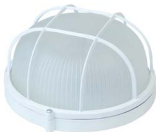
НБП 03-60-002 60W LxWxH,mm (176x90x190) арт.53176