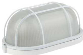
НББ 04-60-002 60W LxWxH,mm (105x85x212) арт.53172