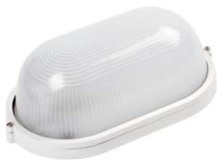
НБП 04-60-001 60W LxWxH,mm (105x80x212) арт.53170