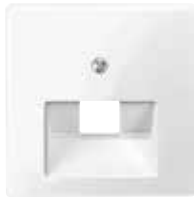
Центральная плата для розетки RJ45, 1 порт

Используется со следующими компонентами: центральная плата для розетки Schneider Electric с разъемом RJ45, 1 порт, System M MTN4698.., MTN4658.., Artec/Antique MTN4664.. Центральная плата для розетки Schneider Electric с разъемом RJ45, 2 порта, System M MTN4699.., MTN4665.., Artec/Antique MTN4666..