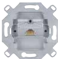
Механизм розетки RJ45 8 кат. 5e

Дизайн: System M. Для механизмов розеток RJ45 8 (кат. 5e) и розеток RJ45 фирмы Rutenbeck, модулей E-Dat фирмы VTR Используется со следующими компонентами: механизм розетки RJ45 8 кат. 5e MTN465721