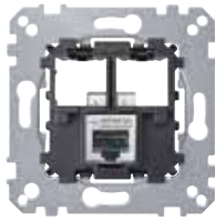
Механизм компьютерной розетки RJ45 Schneider Electric, 1 порт, кат. 6 STP