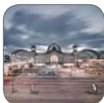
Различные объекты строительства и инфраструктуры