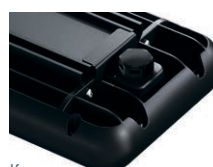
Клапан выравнивания давления