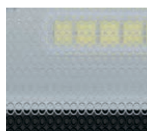
Рассеиватель – призматическое стекло