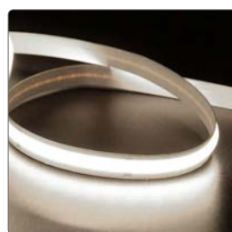
арт. 48948 4000K