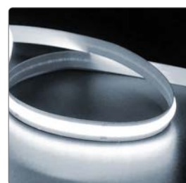
арт. 48949 6500K