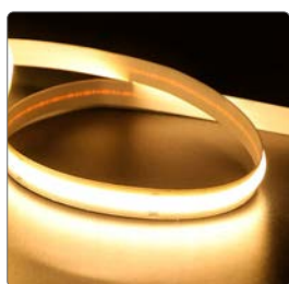
арт. 48947 3000K