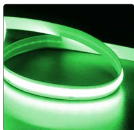
арт. 48951 ● зеленый