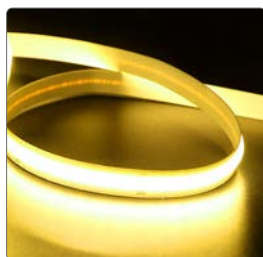
арт. 48950 ● желтый