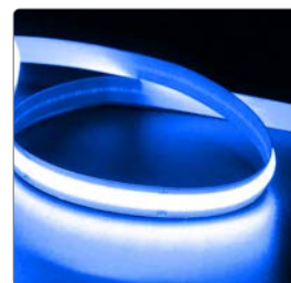
арт. 48953 ● синий