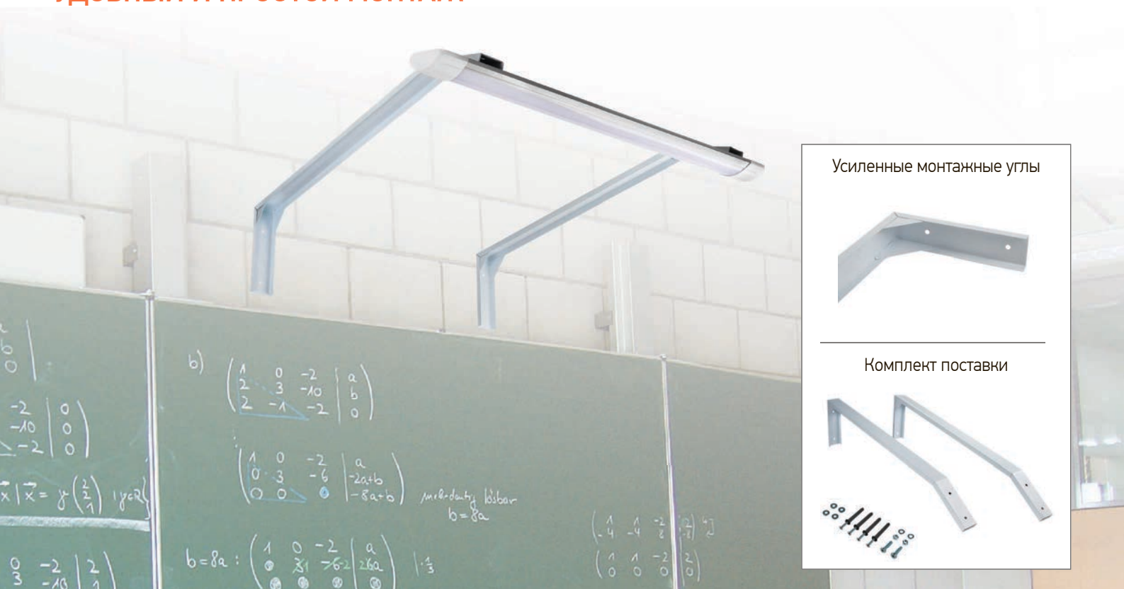
Усиленные монтажные углы

КОРПУС ИЗ ЛИСТОВОЙ СТАЛИ С ПОРОШКОВОЙ ОКРАСКОЙ УДОБНЫЙ И ПРОСТОЙ МОНТАЖ