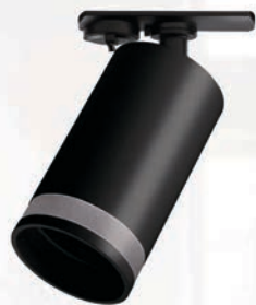
PTR 38 GU10 BL

МАТЕРИАЛ КОРПУСА ИЗ ПОЛИКАРБОНАТА ШИРОКИЙ ВЫБОР МОЩНОСТЕЙ И ЦВЕТОВЫХ ТЕМПЕРАТУР ПОДХОДЯТ ДЛЯ ДИММИРУЕМЫХ ЛАМП