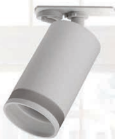
PTR 38 GU10 WH

Адаптер для подключения к однофазному шинопроводу является конструктивным элементом светильника.