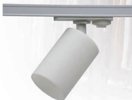
PTR 36 GU10 WH

Адаптер для подключения к однофазному шинопроводу является конструктивным элементом прожектора.