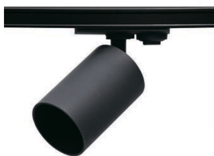
PTR 36 GU10 BL