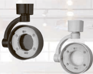
PTR 32 GX53

Адаптер для подключения к однофазному шинопроводу является конструктивным элементом светильника.