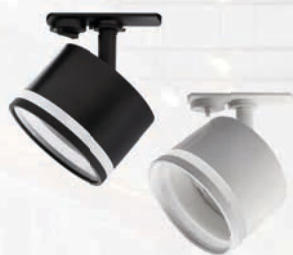
PTR 31 GX53