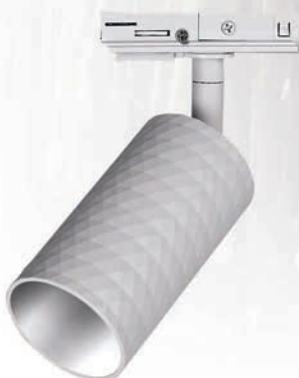
PTR 29 GU10 WH

Адаптер для подключения к однофазному шинопроводу является конструктивным элементом прожектора.