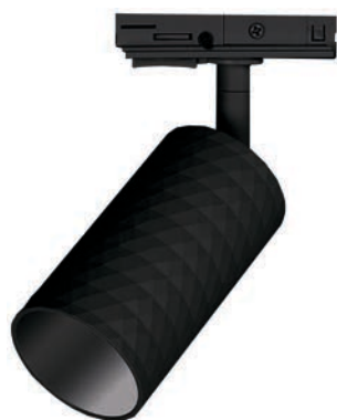
PTR 29 GU10 BL