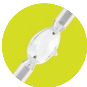
FL HS-I TS 1000W 6100K K12s-36