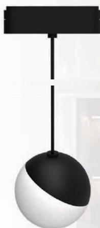
MTR16 3010P-1m 10w