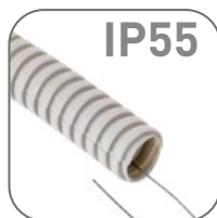
Степень защиты IP55