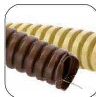
Цвет: белый, серый, светлое дерево, темное дерево