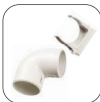
Все необходимые аксессуары