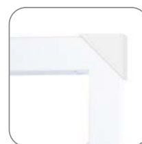
Транспортировочные уголки для металлических люков