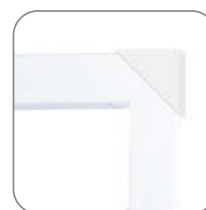
Транспортировочные уголки для металлических люков