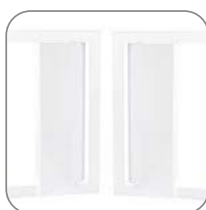
Открывание дверцы с правой или левой стороны