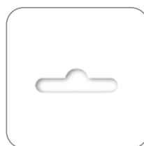
Различная упаковка в пакете с еврослотом