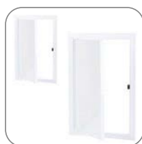
Большой ассортимент габаритов люков