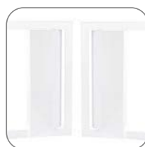
Открывание дверцы с правой или левой стороны