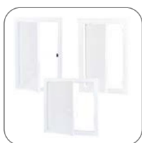
3 варианта исполнения люков

Люки ревизионные применяются для обеспечения оперативного доступа к установленному в нише сантехническому, электротехническому и иному оборудованию. Изготавливаются из пластика и стали. Люки из стали окрашены порошковой краской в белый цвет. На дверце предусмотрен паз для удобного открывания люка. Люки пластиковые изготовлены из пластика белого цвета. Дверца открывается нажимным способом. Люки пластиковые с нажимным замком изготовлены также из пластика, но открытие дверцы производится путем нажатия на замок. Дверца фиксируется в закрытом состоянии при помощи нажимного замка. Габаритный размер, указанный в названии и артикуле продукции, – это габарит по внутренней рамке, монтируемой в нишу.