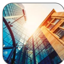
ТЦ, БЦ, вокзалы, аэропорты, офисы