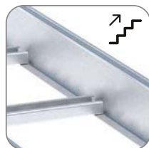
Возможность модернизации монтажной системы