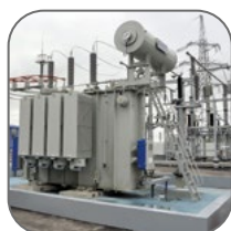
Объекты энергетической отрасли