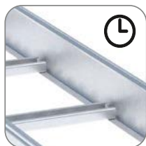
Быстрая и удобная сборка и монтаж кабельной трассы