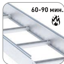
Сохраняет работоспособность в течение 60–90 мин. при воздействии открытого пламени