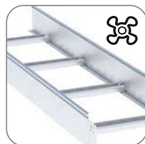
Обеспечивает естественную вентиляцию кабельной трассы