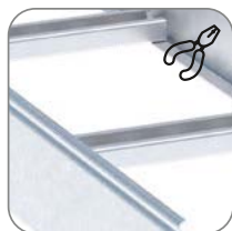
Удобство обслуживания электропроводки