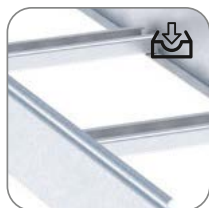
Высокие показатели прочности и нагрузочной способности