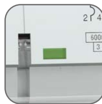
Окно реального состояния контактов с защитой от искр