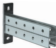
STRUT-система для высоких кабельных нагрузок