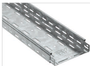
Лотки листовые (длина до 6000 мм)