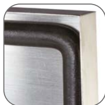
Стойкость к коррозии