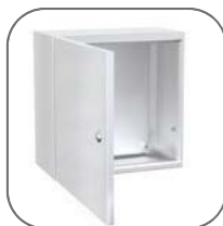
Стойкость к агрессивным веществам