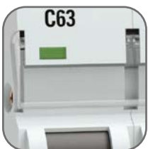
Удобное окно для маркировки цепи