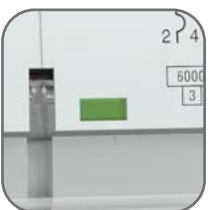
Окно реального состояния контактов с защитой от искр