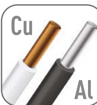
Возможна коммутация алюминиевым и медным проводником