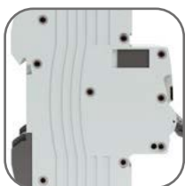
Жесткий корпус, 9 заклепок