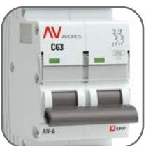
Литая лицевая панель