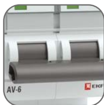
Механизм мгновенной коммутации (ММК)

Выключатели автоматические серии AV-6 EKF AVERES предназначены для оперативно-го управления участками электрических цепей, а также для защиты от токов перегрузки и короткого замыкания в административных, промышленных и жилых зданиях. Выключатели производятся в одно-, двух-, трех- и четырехполюсном исполнении. Номинальная наибольшая отключающая способность (Icn) 6000 А. Полный набор аксессуаров для расширения функций. Гарантийные обязательства 10 лет.