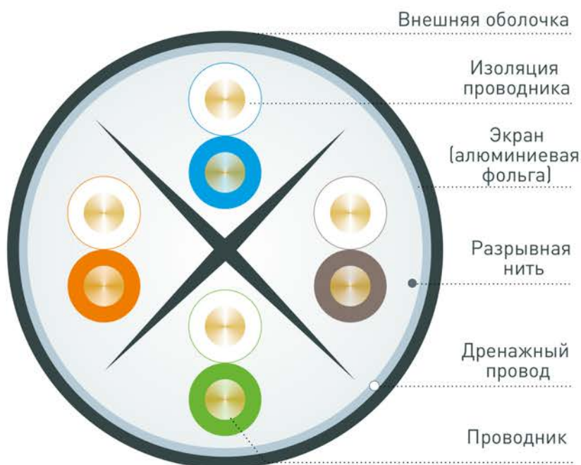
Рис. 2 – Конструкция кабеля F/UTP (количество жил 4x2)