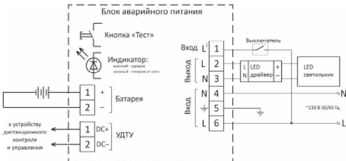
Рисунок 2 – Схема подключения БАП для работы в основном режиме

5.1. Основной режим работы: на рисунке 2 изображена схема подключения БАП для работы в основном режиме. В данном режиме к контактам выхода БАП подключается LED драйвер и LED светильник. Также в этом режиме используется дополнительный контакт питания LI, к которому через выключатель подводится L-проводник. При входном напряжении питания \sim 230 \text{ В} \pm 10\% 50/60 \text{ Гц} LED светильник работает от сети питания, при этом также происходит подзарядка аккумулятора. При понижении входного напряжения до 132 – 187 В БАП переходит в аварийный режим работы, и LED светильник начинает работать от аккумулятора. Время работы светильника в аварийном режим – не менее 1 часа.