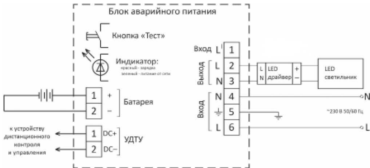
Рисунок 3 – Схема подключения БАП для работы в режиме непостоянного включения

При понижении входного напряжения до 132 – 187 В БАП переходит в аварийный режим работы, и LED светильник начинает работать от аккумулятора. Время работы светильника в аварийном режим – не менее 1 часа.