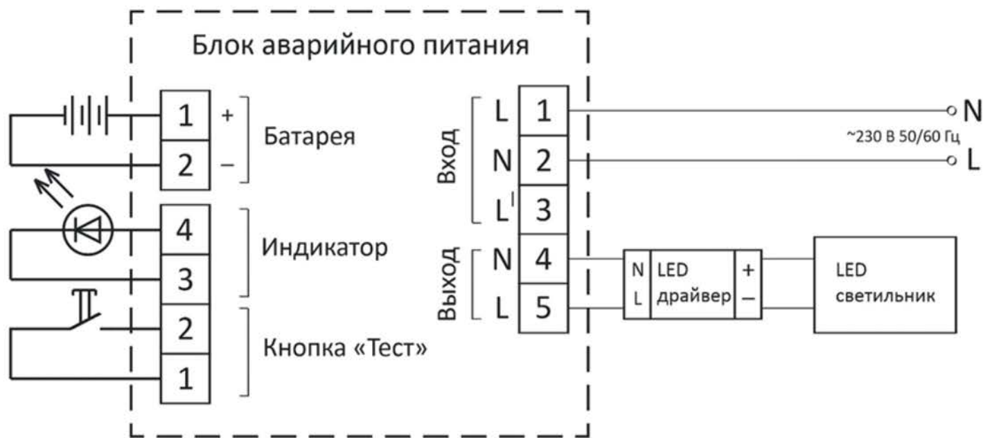
Рисунок 3 – Схема подключения БАП для работы в режиме непостоянного включения

При понижении входного напряжения до 132 - 187 \text{ В} БАП переходит в аварийный режим работы, и LED светильник начинает работать от аккумулятора. Время работы светильника в аварийном режиме – не менее 1 часа.