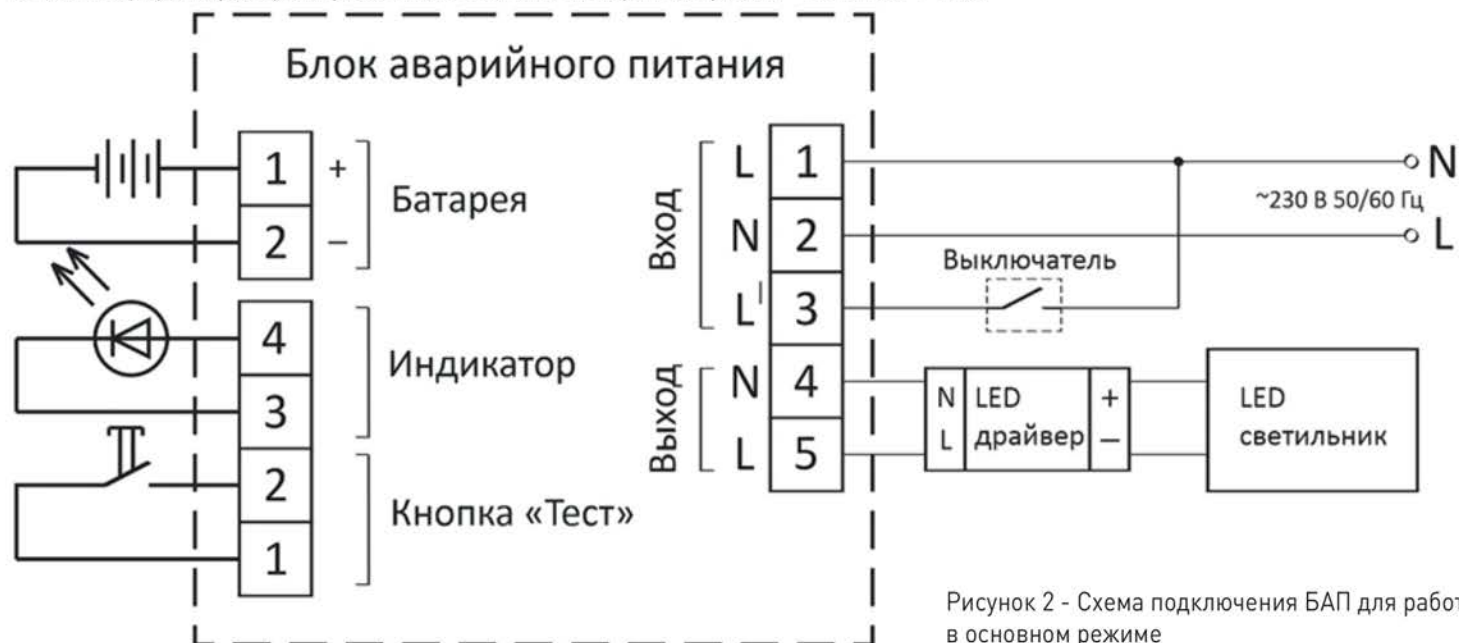
Рисунок 2 - Схема подключения БАП для работы в основном режиме

5.1. Основной режим работы: на рисунке 2 изображена схема подключения БАП для работы в основном режиме. В данном режиме к контактам выхода БАП подключается LED драйвер и LED светильник. Также в этом режиме используется дополнительный контакт питания L1, к которому через выключатель подводится L-проводник. При входном напряжении питания \sim 230 \text{ В} \pm 10\% 50/60 \text{ Гц} LED светильник работает от сети питания, при этом также происходит подзарядка аккумулятора. При понижении входного напряжения до 132 – 187 В БАП переходит в аварийный режим работы, и LED светильник начинает работать от аккумулятора. Время работы светильника в аварийном режим – не менее 1 часа.