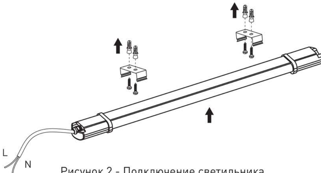
Рисунок 2 - Подключение светильника

5.7 По истечении срока службы светильник утилизировать.