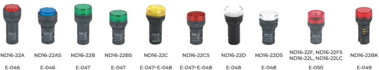
ND16-22A E-046 ND16-22AS E-046 ND16-22B E-047 ND16-22BS E-047 ND16-22C E-047-E-048 ND16-22CS E-047-E-048 ND16-22D E-048 ND16-22DS E-048 ND16-22F, ND16-22FS, ND16-22L, ND16-22LC E-050 ND16-22BK E-049