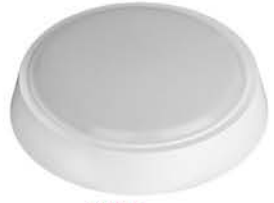
20Вт 210*33 мм

ГАБАРИТЫ СВЕТИЛЬНИКОВ БОЛЬШЕ, ЧЕМ АНАЛОГИ У КОНКУРЕНТОВ!