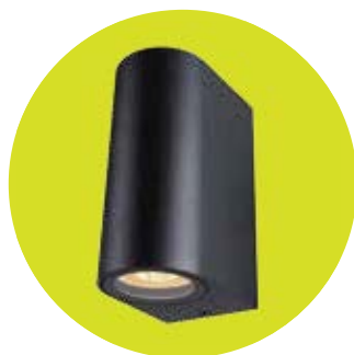
FL-LED WallBeam-Box BARREL-UD005 UP/DOWN Black