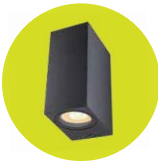
FL-LED WallBeam-Box CUBE-UD004 UP/DOWN Black