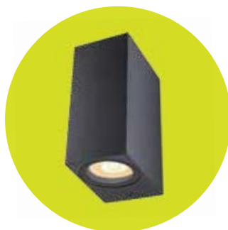
FL-LED WallBeam-Box CUBE-UD004 UP/DOWN Black