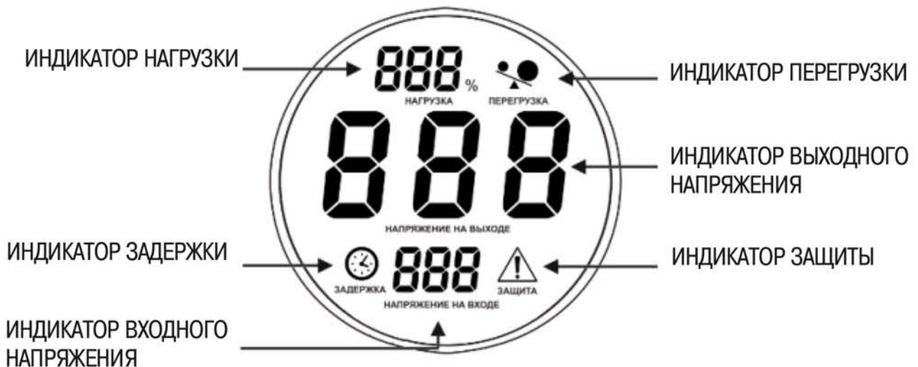
Рисунок 3 – Индикация режимов работы стабилизаторов

3.5 На передней панели корпуса стабилизатора расположен дисплей, отображающий режимы работы. Значение выходного напряжения отображается с точностью, указанной в таблице 2.