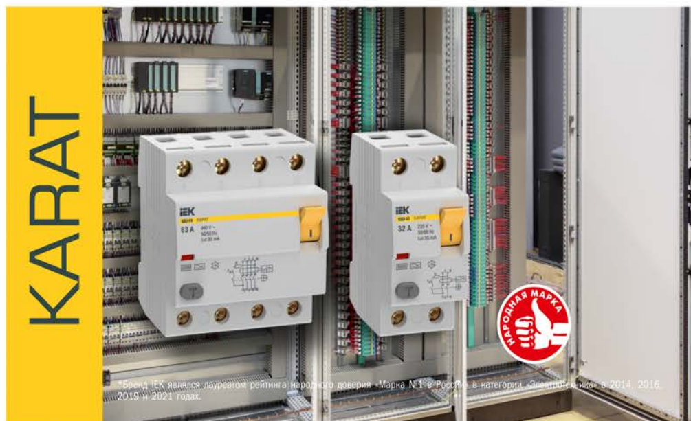
* Бренд IEK являлся лауреатом рейтинга народного доверия «Марка №1 в России» в категории «Электрооборудование» в 2014, 2016, 2019 и 2021 годах.

Выключатель электромеханического типа: не зависит от напряжения сети и не имеет собственного потребления электроэнергии. Без встроенной защиты от токов перегрузки и короткого замыкания.