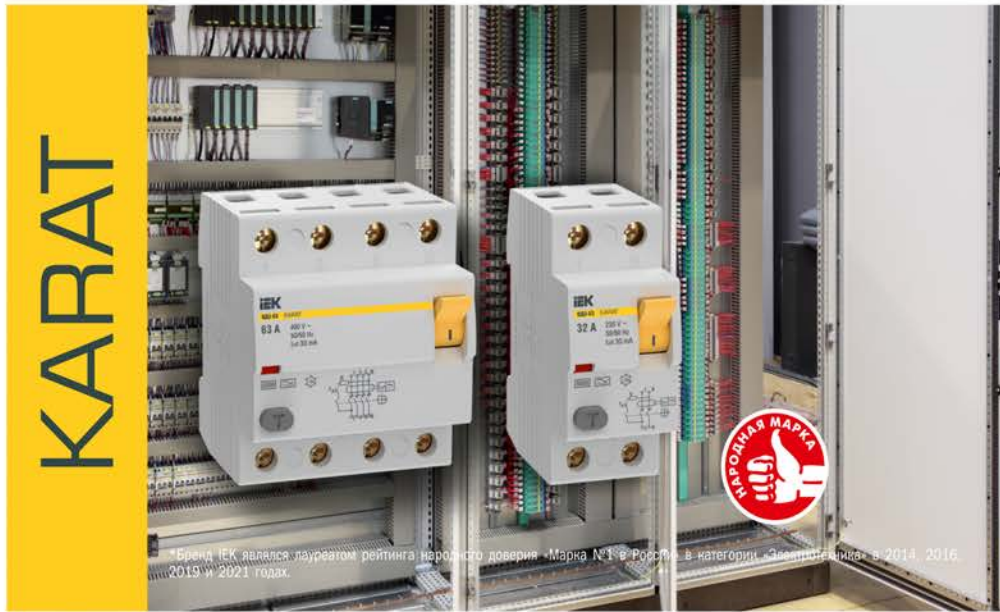
*Бренд IEK являлся лауреатом рейтинга народного доверия «Марка №1 в России» в категории «Электрооборудование» в 2014, 2016, 2019 и 2021 годах.

Выключатель электромеханического типа: не зависит от напряжения сети и не имеет собственного потребления электроэнергии. Без встроенной защиты от токов перегрузки и короткого замыкания.