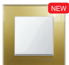
M-Elegance Стекло, золото/полярно-белый