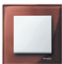
M-Elegance Стекло, махагон/полярно- белый