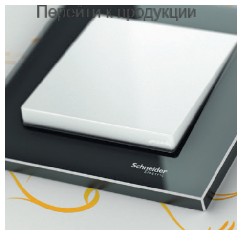
M-Elegance Стекло, оникс/полярно-белый

Эта серия рамок M-Elegance отличается своим материалом – высококачественным стеклом. Элегантные внешние кромки усиливают приятное ощущение чистоты и строгости.