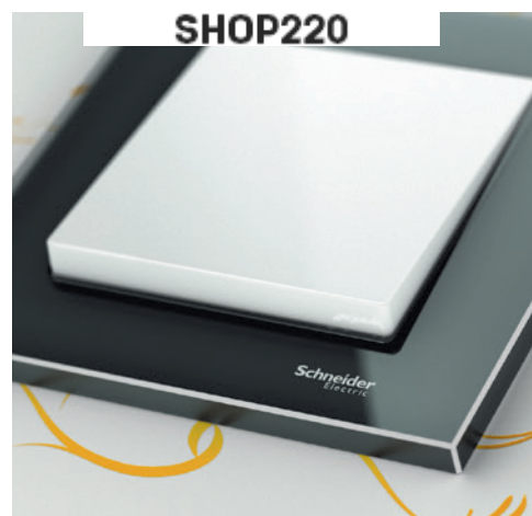
M-Elegance Стекло, оникс/полярно-белый

Эта серия рамок M-Elegance отличается своим материалом – высококачественным стеклом. Элегантные внешние кромки усиливают приятное ощущение чистоты и строгости.