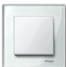
M-Elegance Стекло, бриллиант/ полярно-белый