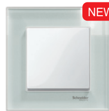
M-Elegance Стекло, белый кристалл/ полярно-белый