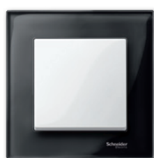
M-Elegance Стекло, оникс/полярно-белый