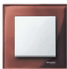
M-Elegance Стекло, махагон/полярно- белый