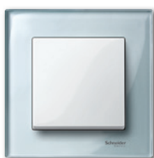
M-Elegance Стекло, алмаз/полярно-белый