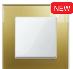
M-Elegance Стекло, золото/полярно-белый