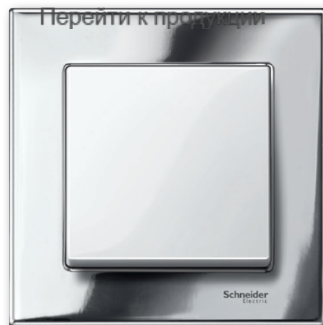
M-Elegance Металл, хромовый/полярно-белый

Серия Merten M-Elegance Металл отличается высококачественными материалами, чистотой поверхности и сдержанными цветами: благородные платина-серебро и родий, блестящий полированный хром или эксклюзивный титан.