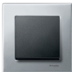
M-Elegance Металл, платина-серебро/ антрацит