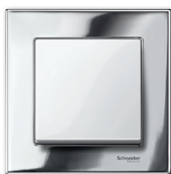
M-Elegance Металл, хром/полярно-белый