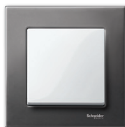
M-Elegance Металл, родий/полярно-белый