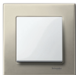
M-Elegance Металл, титан/полярно-белый