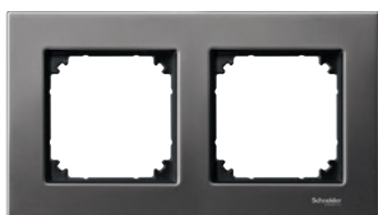
Рамка металлическая, 2 поста*