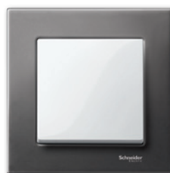
M-Elegance Металл, родий/полярно-белый