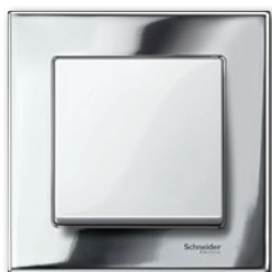
M-Elegance Металл, хром/полярно-белый