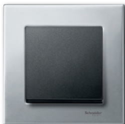
M-Elegance Металл, платина-серебро/ антрацит