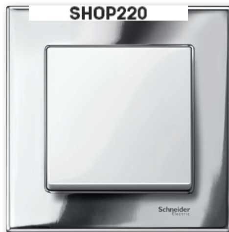
M-Elegance Металл, хромовый/полярно-белый

Серия Merten M-Elegance Металл отличается высококачественными материалами, чистотой поверхности и сдержанными цветами: благородные платина-серебро и родий, блестящий полированный хром или эксклюзивный титан.