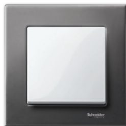
M-Elegance Металл, родий/полярно-белый