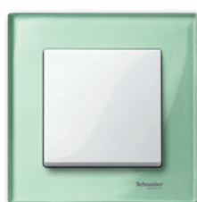
M-Elegance Стекло, изумруд/полярно- белый