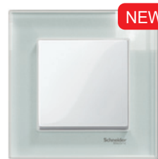
M-Elegance Стекло, белый кристалл/ полярно-белый