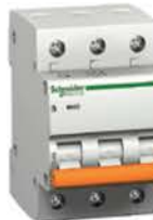
Трёхполюсный автоматический выключатель