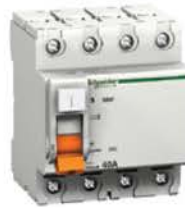
Четырёхполюсный дифференциальный выключатель нагрузки (УЗО)