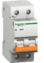
Двухполюсный автоматический выключатель (полюс+нейтраль)