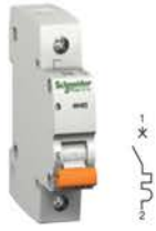
Однополюсный автоматический выключатель

Технический регламент Таможенного союза ТР ТС 004/2011 «О безопасности низковольтного оборудования» ГОСТ 9098-78, ГОСТ Р 50345-2010 (МЭК 60898-1:2003)