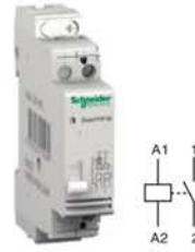
Импульсное реле TL

ГОСТ Р 51324.2.2-2012 (МЭК 60669-2-2-2006)