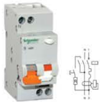
Дифференциальный автоматический выключатель

Технический регламент Таможенного союза ТР ТС 004/2011 «О безопасности низковольтного оборудования» Технический регламент Таможенного союза ТР ТС 020/2011 «Электромагнитная совместимость технических средств» ГОСТ Р 51327.1-2010 (МЭК 61009-1-2006)