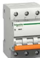
Трёхполюсный автоматический выключатель