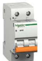
Двухполюсный автоматический выключатель (полюс+нейтраль)