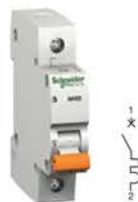
Однополюсный автоматический выключатель

Технический регламент Таможенного союза ТР ТС 004/2011 «О безопасности низковольтного оборудования» ГОСТ 9098-78, ГОСТ Р 50345-2010 (МЭК 60898-1:2003)