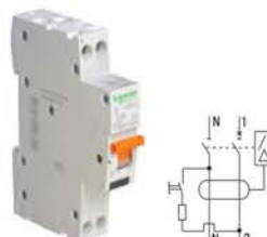
Дифференциальный автоматический выключатель АД63 К

Технический регламент Таможенного союза ТР ТС 004/2011 «О безопасности низковольтного оборудования» Технический регламент Таможенного союза ТР ТС 020/2011 «Электромагнитная совместимость технических средств» ГОСТ Р 51327.1-2010 (МЭК 61009-1-2006)