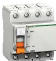
Четырехполюсный дифференциальный выключатель нагрузки (УЗО)