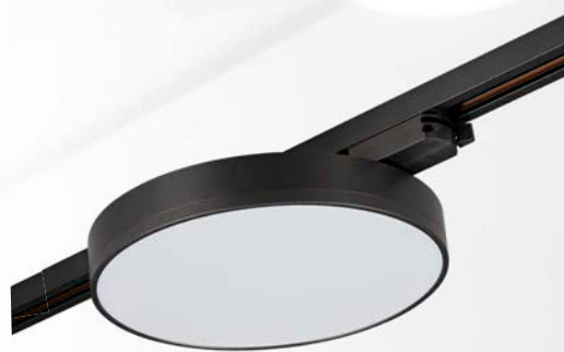
PTR 1835-T540 32w BL