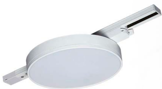
PTR 1835-T540 32w WH