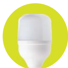
FL-LED T100 / T120