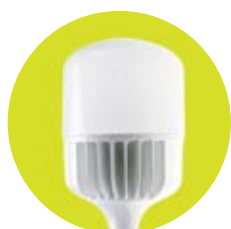
T140 / T150