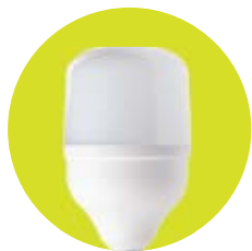
FL-LED T100 / T120